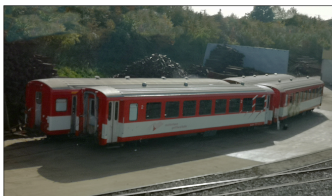
Am 8. Oktober 2023 warteten vier ehemalige FO-Personenwagen in Kaiseraugst auf die Verschrottung.