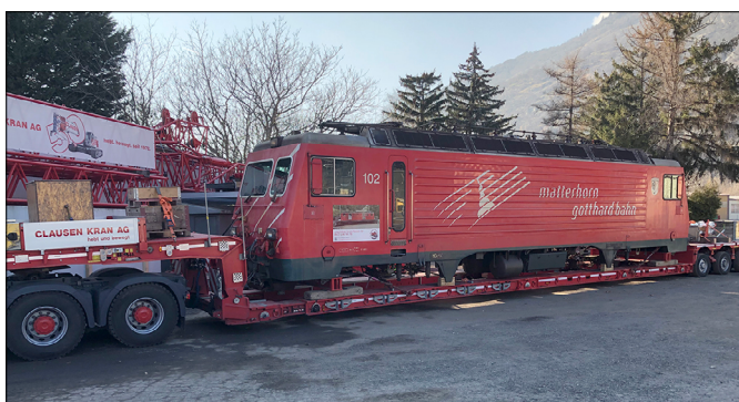
Vor Abfahrt in Brig-Glis