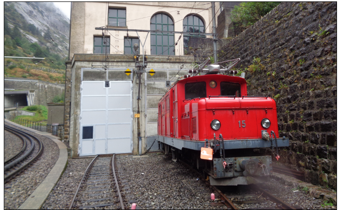
Lok Nr. 15 musste draussen warten.

Mangels Platz in der Depotwerkstätte in Göschenen stand das BVZ-Krokodil HGe 4/4 Nr. 15 während vieler Monate ausserhalb des Gebäudes. Die Lok war am Gleis angekettet, dass sie bei einem allfälligen Bremsdefekt nicht wegrollen konnte. Dies wurde verschiedentlich fotografiert. Inzwischen steht unsere Nr. 15 wieder unter dem schützenden Dach der Depothalle.