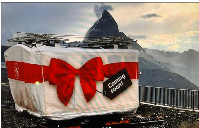
Am 18. August 2023 stand die He 2/2 Nr. 3003 als Geschenk verpackt auf dem Gornergrat.