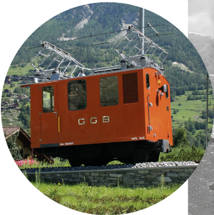
Kleinlok He 2/2 Nr. 3003 im Zustand von 2018

Artikel von Frederik Kiziak auf unserer Webseite