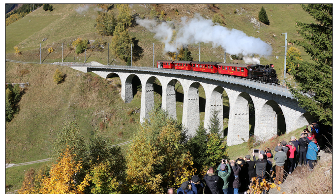
Dampf-Sonderfahrt der DFB am Oberalppass (Val Bugnei-Viadukt bei Sedrun).

Auch die berühmte Schweizer Streuwürze «Knorr Aromat» hat Geburtstag. Die seit Frühjahr 2023 im Verkauf stehende Dose zeigt einen der 1949 bis 1961 beschafften Triebwagen Bhe 2/4 der Gornergrat Bahn.