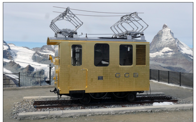
Seit der Enthüllung präsentiert sich die He 2/2 Nr. 3003 in goldener Farbe vor dem Matterhorn.