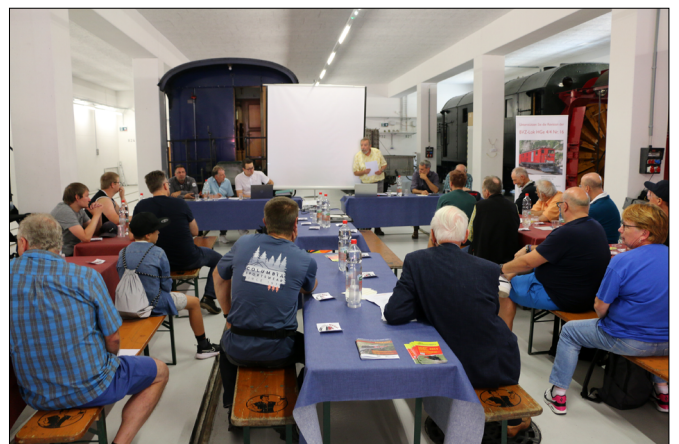
Die DFB-Wagenremise war ein Tagungsort mit historisch passender Kulisse.