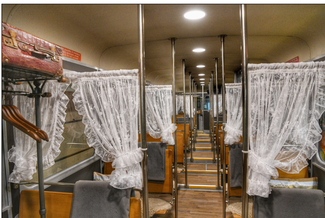
Innenaufnahme des Triebwagens Bhe 2/4 Nr. 3021