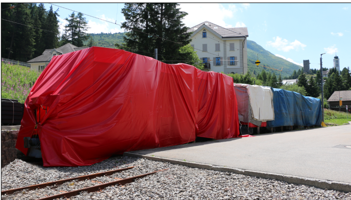
Situation in Hospental am 15.07.2023