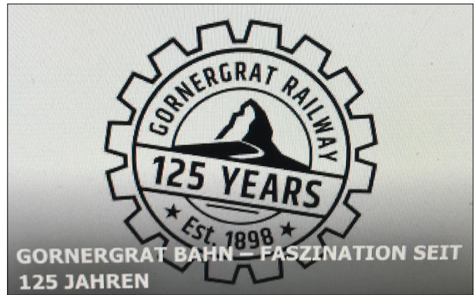
Jubiläumssignet «125 Jahre Gornergrat Bahn» (Screenshot GGB-Webseite)

Die beiden He 2/2 Nr. 3001 und 3002 sind im Besitz der Capanna AG Zermatt. Lok Nr. 3001 kann man als Glanzstück im Hotel Tannenhof in Zermatt bewundern, während die Nr. 3002 beim Parkhaus «Schaller ante portas» in Täsch aufgestellt ist.