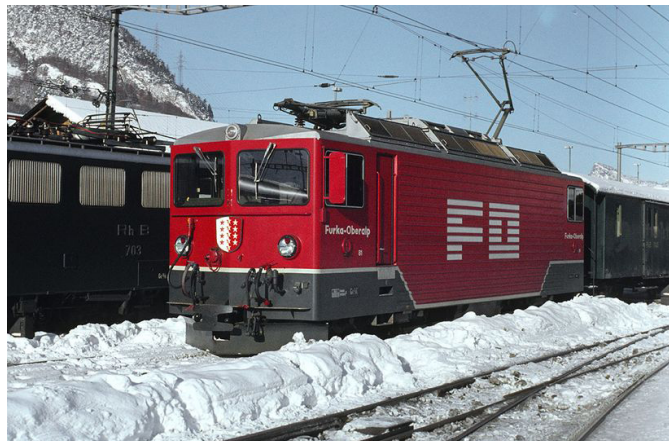
Die beiden Loks Ge 4/4 III der FO waren nach ihrer Ablieferung vorerst 1980/81 bei der RhB im Einsatz. (Januar 1982)