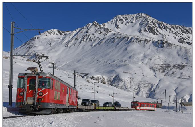
Autozug am Nättschen

Die letzte Fahrt eines Autoverladezuges zwischen Andermatt und Sedrun fand nach über 40 Jahren am Ostermontag, 10. April 2023 statt. Die Verladewagen wurden in der Folge mit einer Ausnahme an die Dampfbahn Furka-Bergstrecke (DFB) abgegeben, die sie als Ersatzteilspender zerlegte und die nicht verwendbaren Teile inzwischen abgebrochen hat. Infos zur Geschichte und Einstellung des Autoverlades Oberalp siehe Webseite der MGBahn.