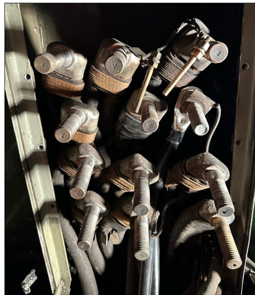
Auch die Anschlussschrauben mussten ersetzt werden.

Die Klemmplatte ist im Führerstand der Lokomotive HGe 4/4 eingebaut. Sie dient dazu, die Laschen und Kabel in der Position zu halten und zu isolieren. Bei einem Motorschaden werden dort die Elektromotoren abgetrennt.