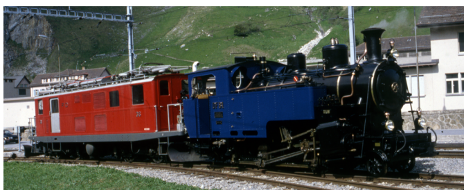
Lok Nr. 36 am 10. August 1993 bei Probefahrten mit der im Reichsbahn-Ausbesserungswerk Meiningen aufgearbeiteten DFB-Dampflokomotive HG 3/4 Nr. 1 in Andermatt.