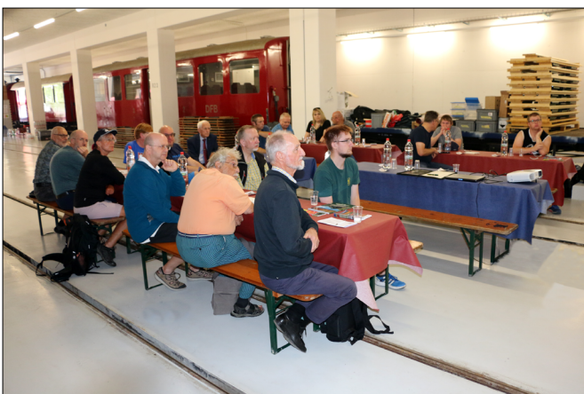
Beim geschäftlichen Teil waren 26 stimmberechtigte Mitglieder (davon auch zwei Damen) anwesend.