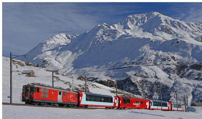
Der Deh 4/4 Nr. 23 (ex BVZ) mit dem Glacier Express auf der Oberalpstrecke.