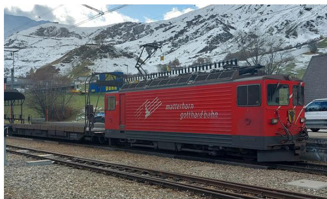
Lok Ge 4/4 III Nr. 81 kurz vor ihrer Ausrangierung an der Autorampe in Realp.