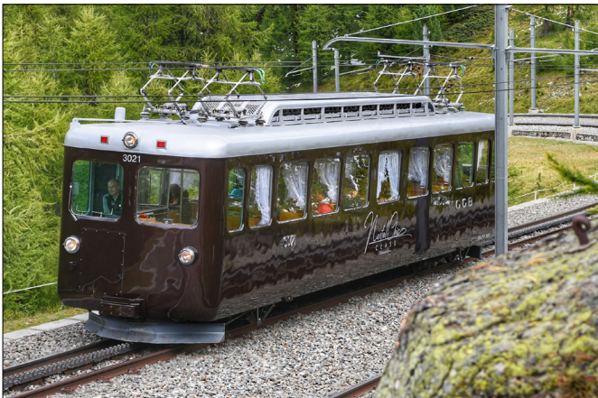
Der Triebwagen Bhe 2/4 Nr. 3021 «NostalChic Class» bei einer ersten Publikumsfahrt am 1. Sept. 2023.