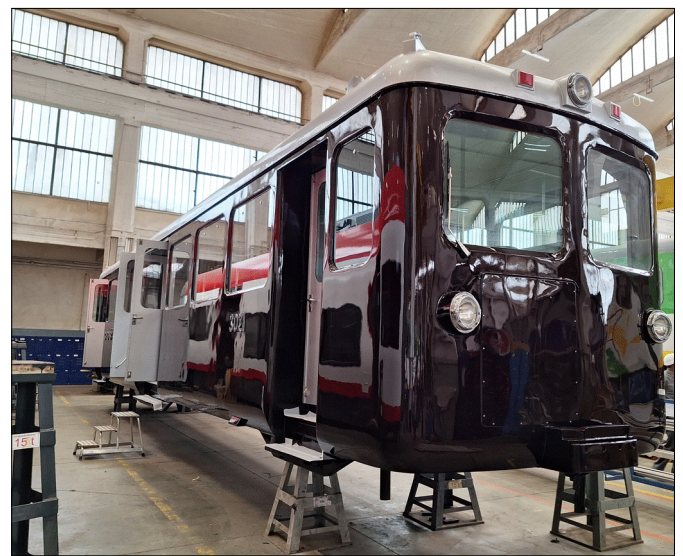
Der Triebwagen Bhe 2/4 Nr. 3021 während dem Umbau in Polen.

Der GGB-Triebwagen Bhe 2/4 Nr. 3021 wurde restauriert und für das neue Reiseangebot «NostalChic Class» umgestaltet. Der Umbau erfolgte in Minsk (Polen). Das schicke Fahrzeug steht seit September 2023 im Sonderzugseinsatz. Weitere Informationen