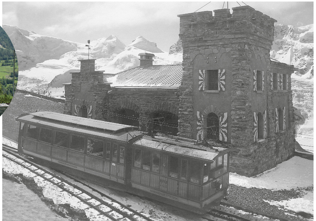
Rowan-Zug mit Kleinlok He 2/2 um 1910 auf dem Gornergrat