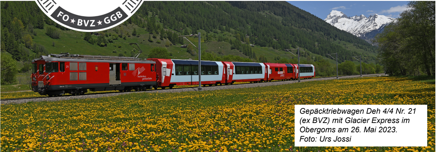
Gepäcktriebwagen Deh 4/4 Nr. 21 (ex BVZ) mit Glacier Express im Obergoms am 26. Mai 2023.

Redaktion: Beat Moser – Verein MGBahn-Historic, Postfach 80, CH-3900 Brig – info@mgbahn-historic.ch